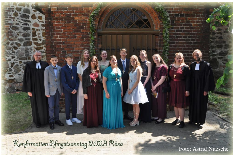
Konfirmation Pfingstsonntag 2023 Rösa