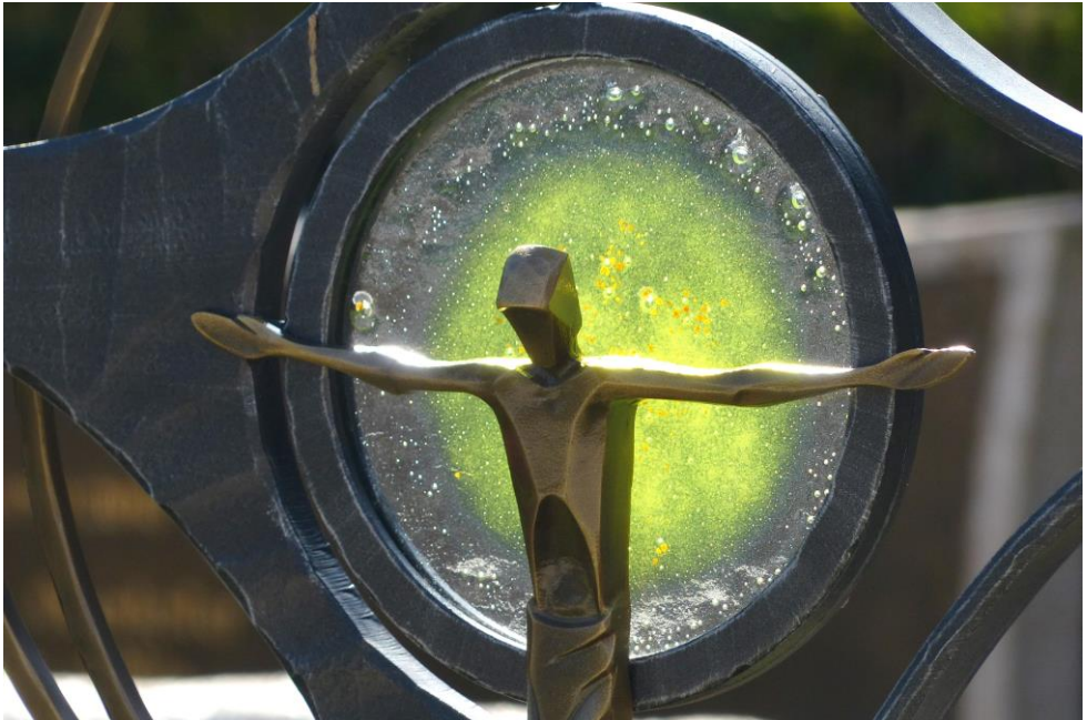
gekreuzigter / segnender Christus auf dem Friedhof in Eppan / St. Pauls in Südtirol

„Wir haben einen Gott, der da hilft, und einen Herrn, der vom Tod errettet.“