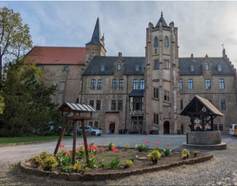
Das Schloss Mansfeld oben / unten das Taufzentrum in Eisleben